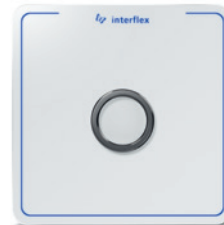
Zutritts-Terminal IF-800 in weißer Ausführung